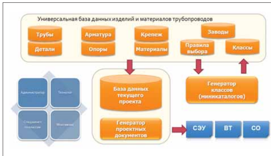
Рис. 4. Структура СУБД ПРОЕКТ

Для решения проблем унификации и стандартизации при выборе конкретных изделий в процессе проектирования, как правило, используются классы (иногда их называют миникаталогами). Класс – конкретный набор всех видов изделий, применяемый в заданных условиях. В качестве условий обычно выступают вид транспортируемого продукта, диапазон температур и диапазон давлений. Отбор изделий в класс происходит с учетом требований нормативных документов и инженерных расчетов.