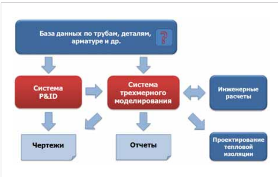
Рис. 2. Основные компоненты автоматизации