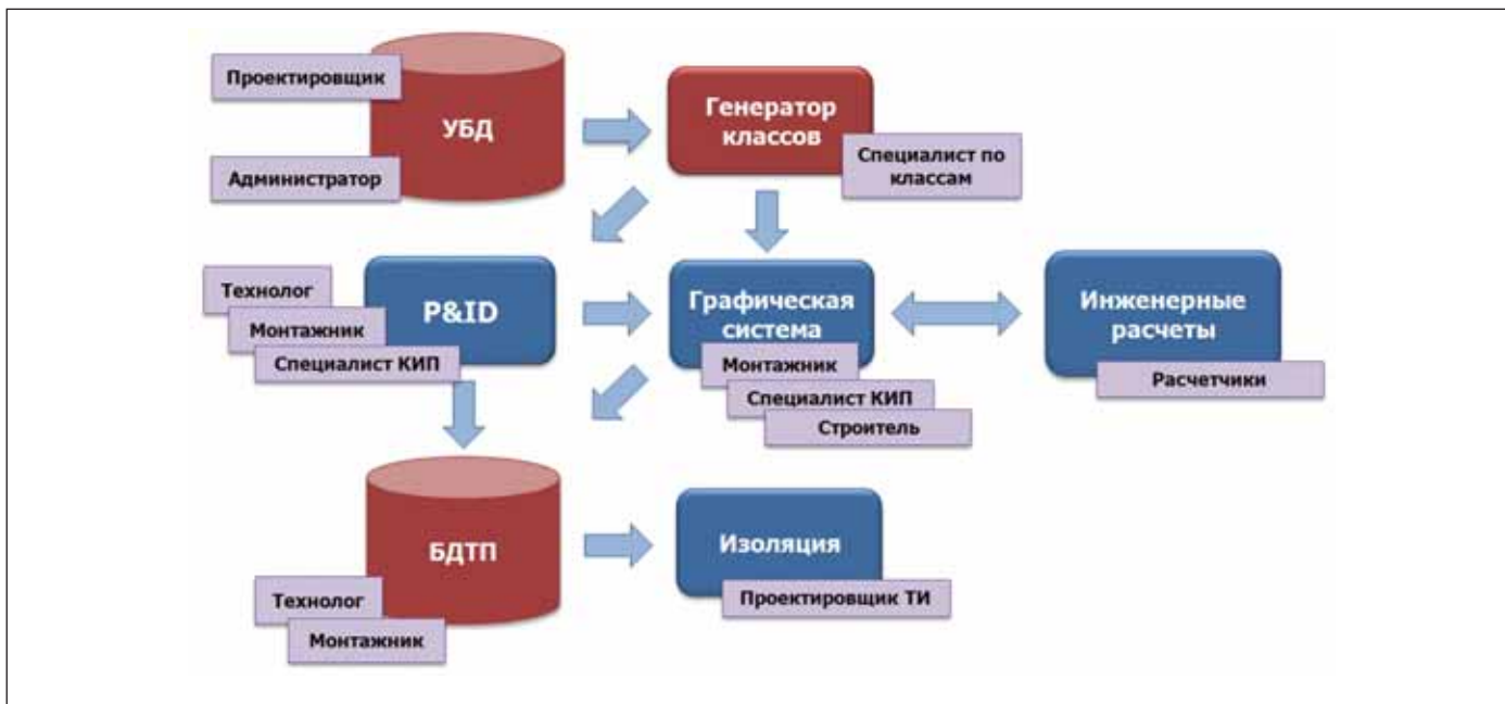
Рис. 11. Схема полной интеграции СУБД ПРОЕКТ

(данные хранятся в СУБД MS SQL Server), рассчитанная на совместную работу технологов и монтажников. Данные программы состоят из перечня участков трубопроводов с их параметрами, а также элементов, входящих в участок (рис. 9).