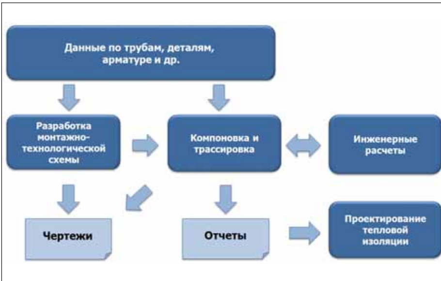
Рис. 1. Процесс монтажного проектирования

СИСТЕМА АВТОМАТИЗАЦИИ УПРАВЛЕНИЯ ИЗДЕЛИЯМИ И МАТЕРИАЛАМИ И ВЫПУСКА ПРОЕКТНОЙ ДОКУМЕНТАЦИИ ПРИ МОНТАЖНОМ ПРОЕКТИРОВАНИИ