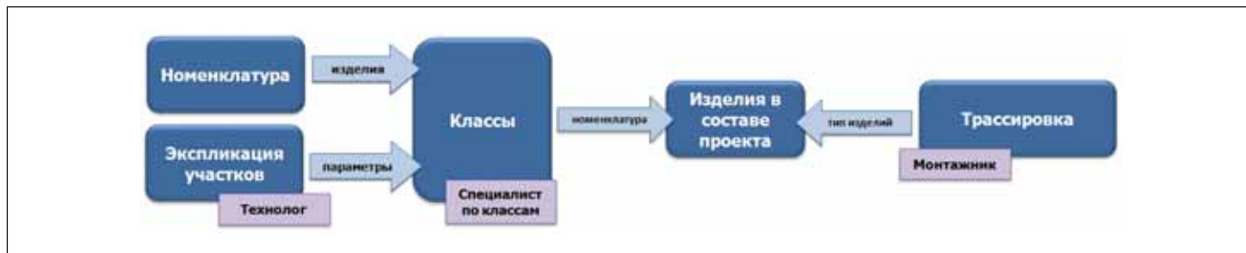
Рис. 3. Выбор изделий при использовании классов

систем может быть затруднено вплоть до отказа от их использования.