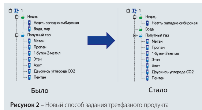
Рисунок 2 – Новый способ задания трехфазного продукта

Для упрощения расчета промышленных трубопроводов в интерфейс программы было внесено несколько изменений. Во-первых, в дереве проекта воду стало возможно задавать как отдельный продукт, а не как компонент жидкой фазы, как было раньше (рис. 2).